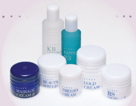
化粧品の選び方がわかる