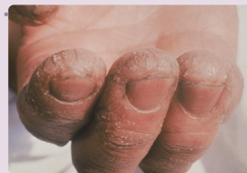
手荒れがひどくなる前に