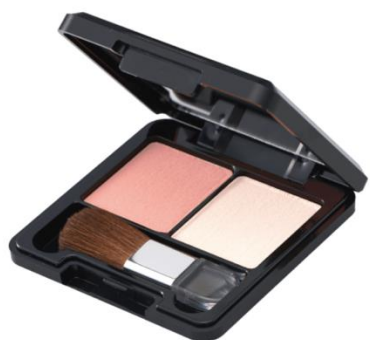
ゼノア フェイスカラー