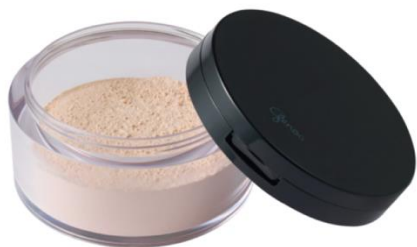
ゼノア フェイシャルパウダー